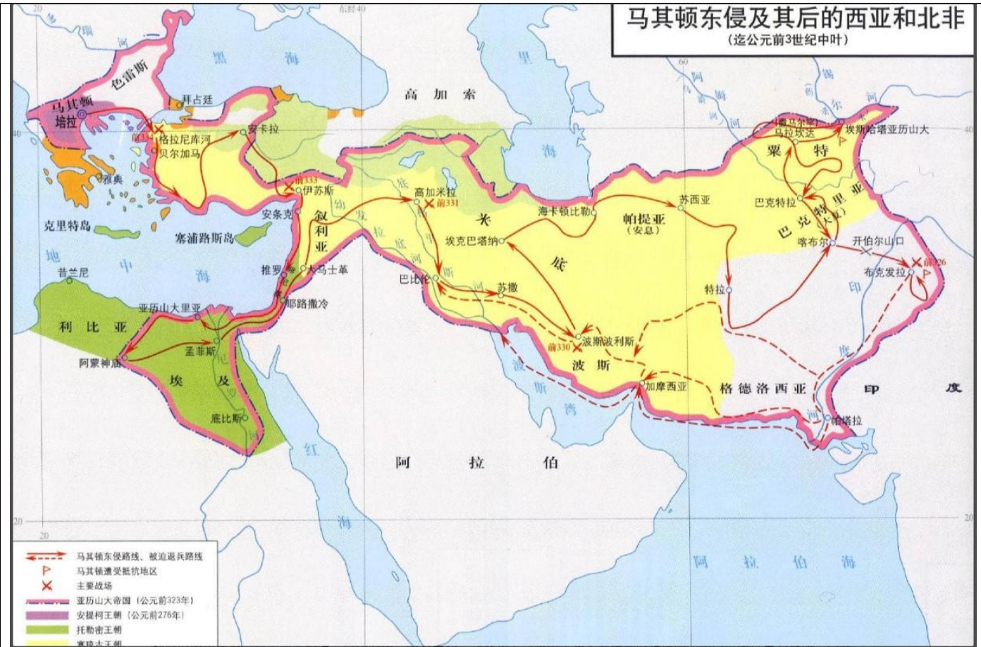
2 亞歷山大帝: 西元前 355 年- 西元前 322 年.